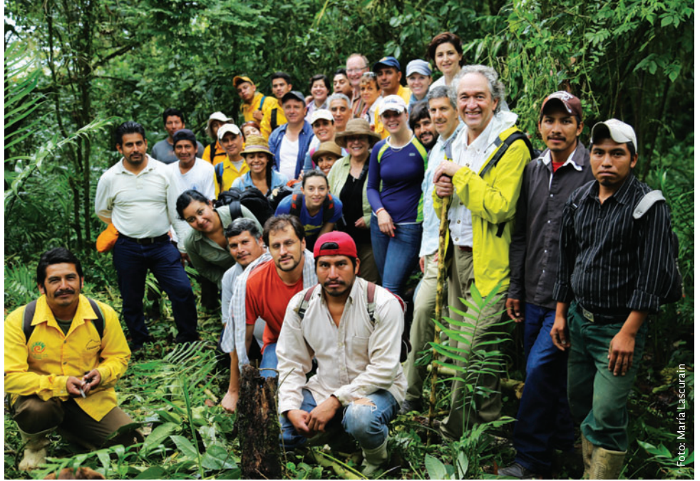
El equipo de la Alianza México REDD+ con ejidatarios del ejido Villahermosa en Chiapas.

El mecanismo REDD+ surge en la Convención Marco de las Naciones Unidas sobre Cambio Climático como una opción dentro los esfuerzos globales para mitigar el cambio climático, ya que busca desacelerar, frenar y revertir la pérdida de cubierta forestal y de carbono. Además, este mecanismo reconoce la importancia que tienen los bosques por su biodiversidad y por ser sustento de vida de muchas comunidades y ejidos.